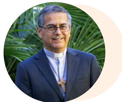
Sergio Pérez de Arce Arriagada Obispo de Chillán

La Iglesia en Ñuble no tiene cien años, su presencia y su misión en estas tierras se confunde con la misma historia de nuestra Región desde los tiempos de la Colonia, con más de 400 años de camino y numerosos hombres y mujeres dando testimonio de su fe y formando diversas comunidades e instituciones católicas.